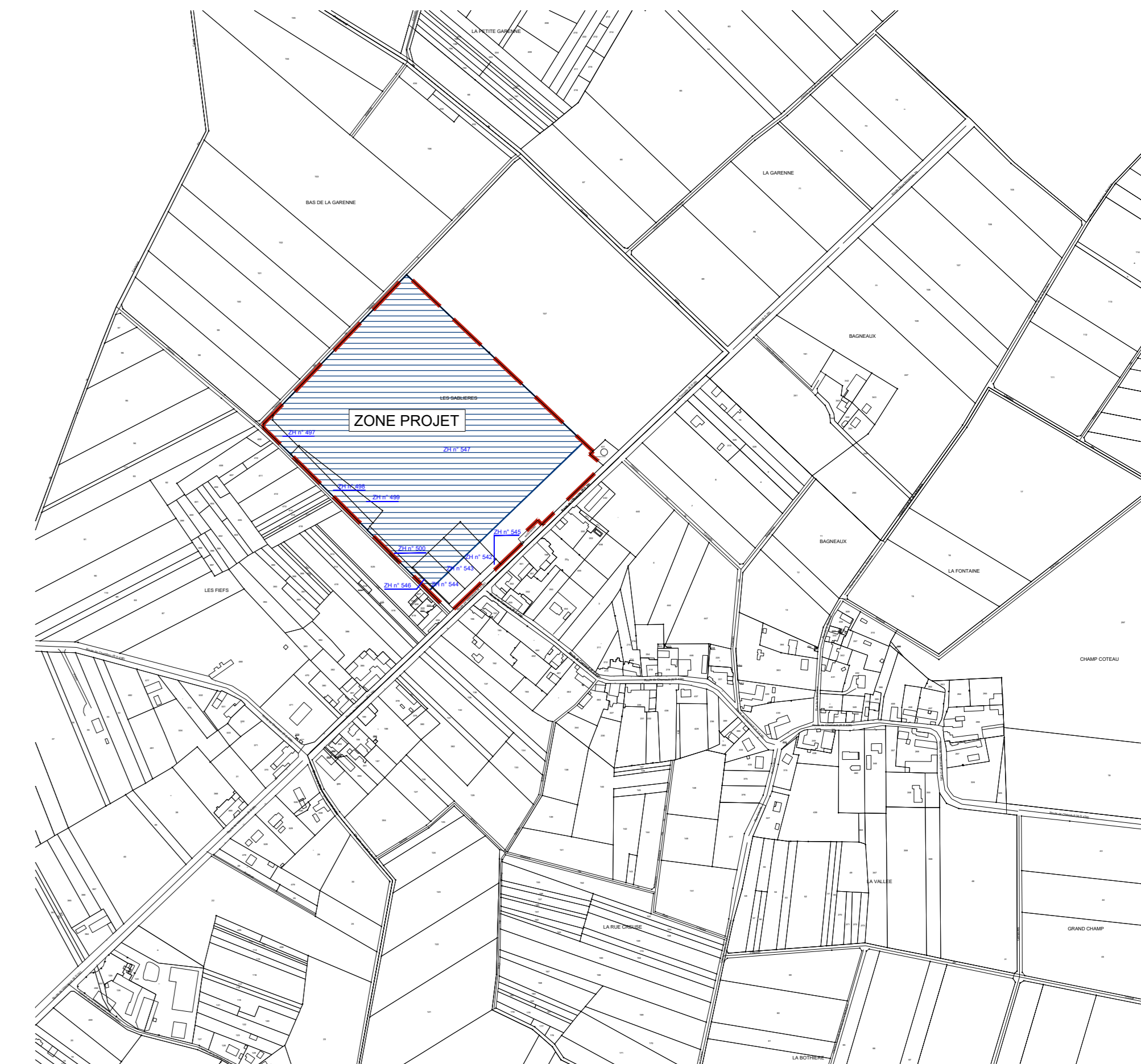
Cadastre 1/5 000e