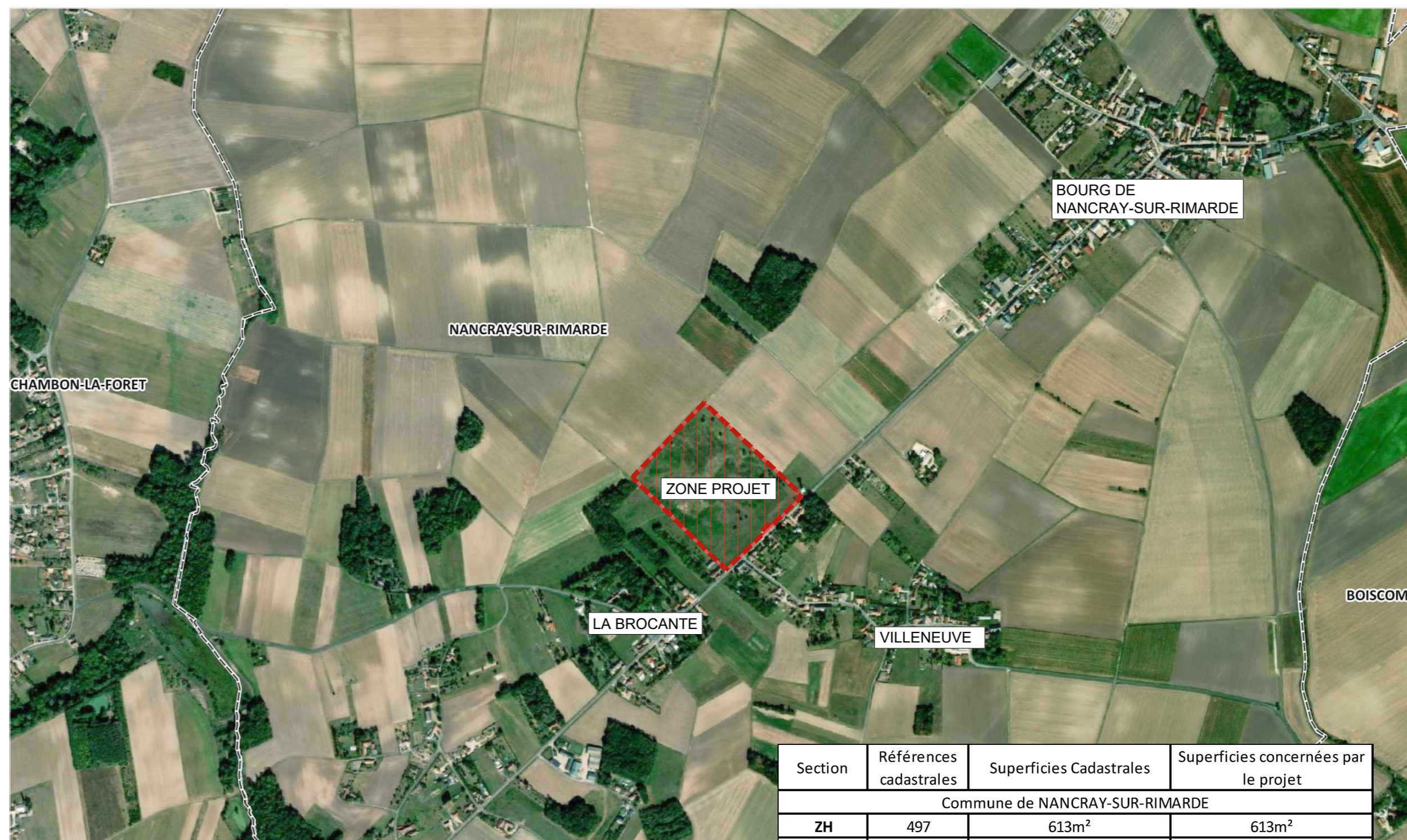
Vue aérienne_Echelle : 1/10 000e